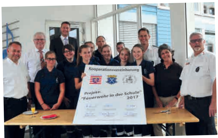
IM EINSATZ IN DER SCHULE: FREIWILLIGE FEUERWEHR BAD HOMBURG