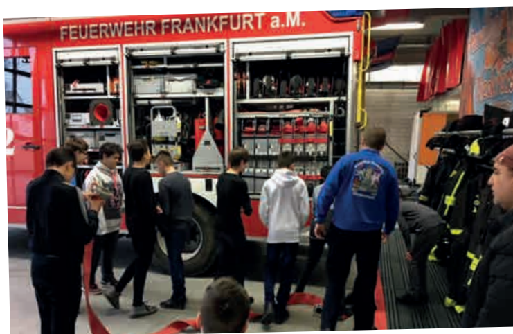
IM EINSATZ IN DER SCHULE: FREIWILLIGE FEUERWEHR NIEDERURSEL