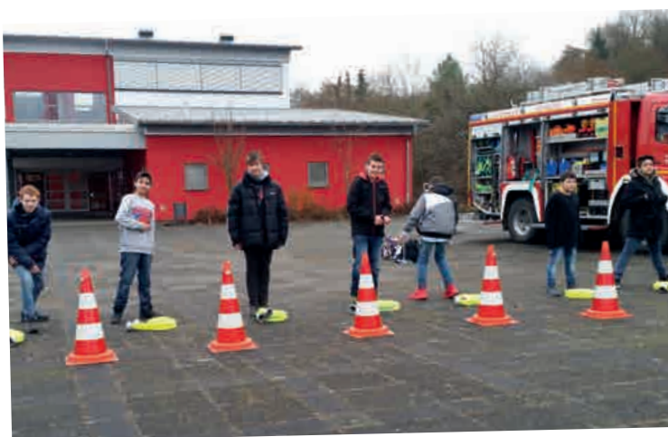
IM EINSATZ IN DER SCHULE: FREIWILLIGE FEUERWEHR HERBORN