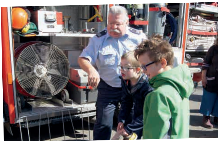
IM EINSATZ IN DER SCHULE: FREIWILLIGE FEUERWEHR HANAU

Ein Fachlehrkraft, selbst Feuerwehrmann in einer anderen Kommune, kam auf uns zu und wollte