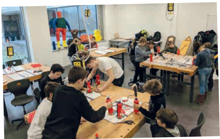
IM EINSATZ IN DER SCHULE: FREIWILLIGE FEUERWEHR USINGEN

Schlecht: Zum Teil war das Zeitfenster insbesondere bei praktischen Übungen (Dienstkleidung an- und ausziehen, auf die Übungsprozesse vor- und nachbereiten, sicherheitsrelevante Aspekte (Unfallverhütung, sowie für Auf- und Abbau (z.B. einer Feuerwehrrübung) zu klein.