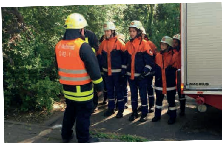
IM EINSATZ IN DER SCHULE: FREIWILLIGE FEUERWEHR NIEDERRAD