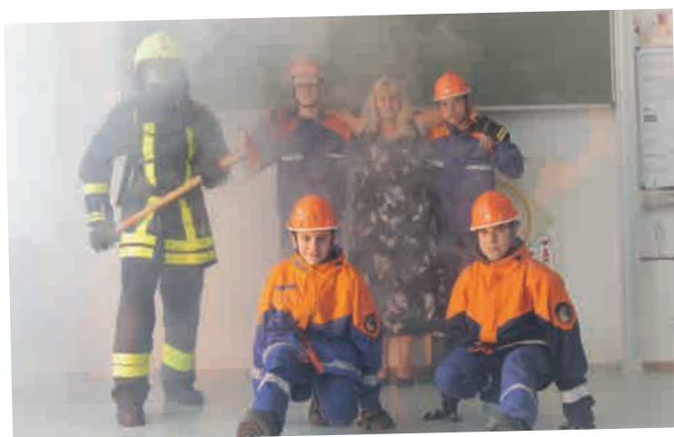
IM EINSATZ IN DER SCHULE: FREIWILLIGE FEUERWEHR GRIESHEIM

In den Sommermonaten finden zum größten Teil praktische Diensteinheiten statt. Die Wintermonate hingegen werden genutzt, um theoretische Grundlagen zu schaffen und zu festigen.