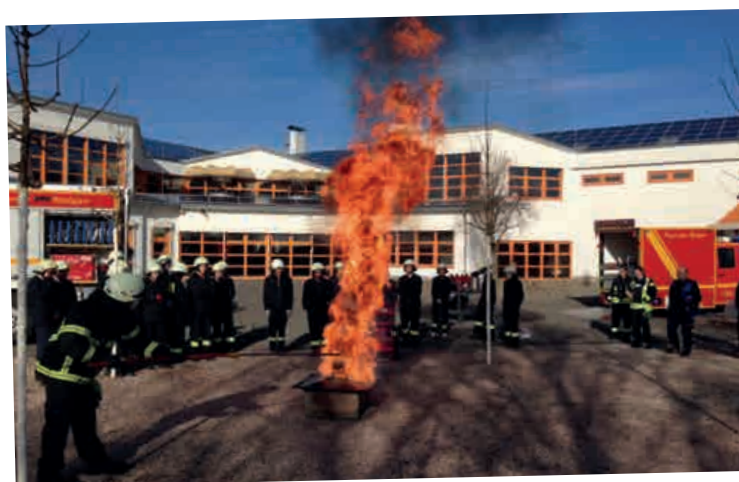
IM EINSATZ IN DER SCHULE: FREIWILLIGE FEUERWEHR RODGAU

Das mehrstufige Ausbildungsprogramm verzahnt unter einem ganzheitlichen Ansatz bisher für sich stehende kultusministerielle Sozialprogramme (Brandschutzerziehung, Schulsanitätsdienst, Bewegte Schule, Berufs- und Studienförderung, Amokprävention) im Zeichen der Förderung zivilbürgerlichen Engagements mit einer zentralen Aufgabe des Staates: dem Bevölkerungsschutz und der Katastrophenhilfe.